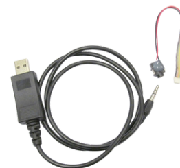
RS-C003 CAVO DI PROGRAMMAZIONE